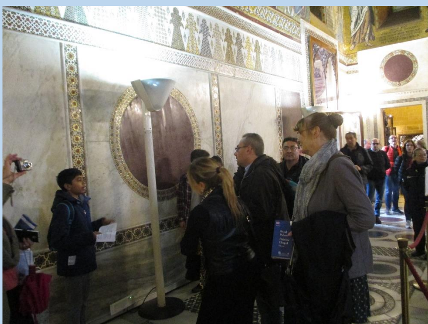
CAPPELLA PALATINA 3.