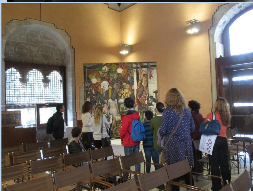
“LA VUCCIRIA” DI GUTTUSO