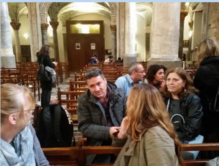
CHIESA DELLA MARTORANA