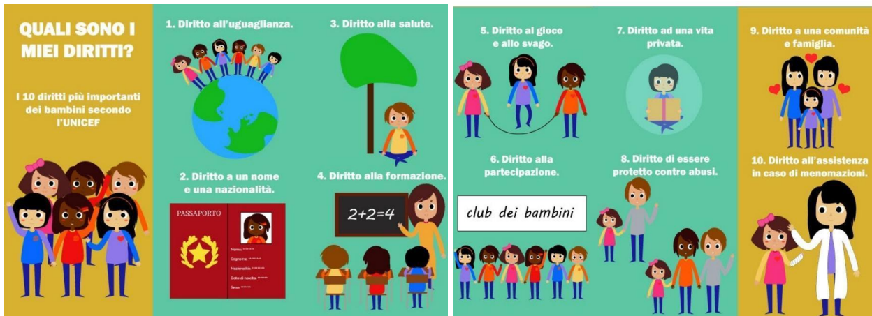
Alcuni degli elaborati degli alunni del liceo artistico "Damiani-Almeyda"